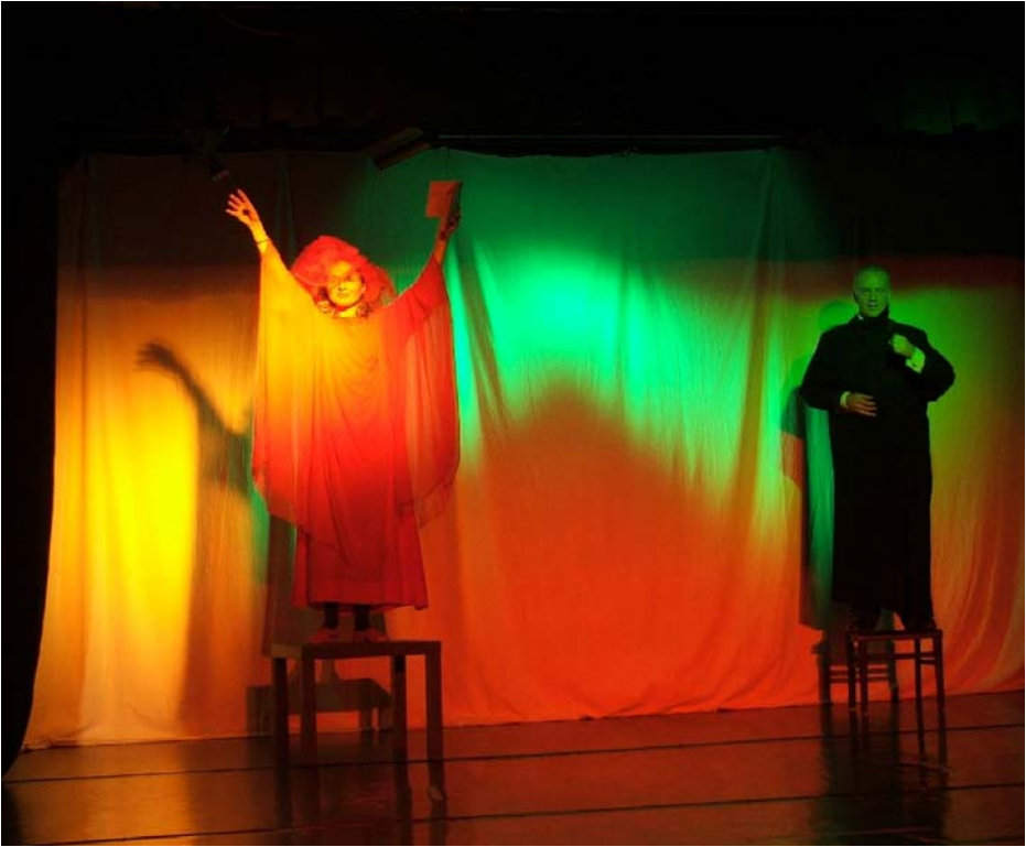
Luzifer und Ahriman in der Seelenwelt (4. Bild)