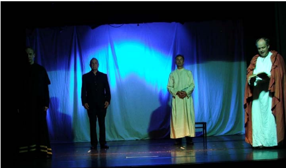
Retardus, Benedictus, Theodosius und Romanus im Felsentempel (5. Bild)

In der verborgenen Mysterienstätte der Hierophanten erscheint Benedictus mit seinen beiden Geistesgefährten Theodosius und Romanus. German fehlt, dafür tritt nun Retardus erstmals auf. Johannes erlebt die ganze Szene tief in Meditation versunken mit. Benedictus hat Johannes zur ersten Geistesschau geführt, doch soll diesem voll bewusst erlebte Wahrheit werden, was er bis jetzt nur als Seelenbild sehen durfte, so muss er Johannes weiter hinauf ins Reich des Geistes leiten. Die Zeit dafür scheint Benedictus reif, doch bedarf er der Hilfe seiner beiden Gefährten, um Johannes weiterzuführen. Theodosius soll Johannes Herz mit der Weltenkraft der Liebe erfüllen und Romanus soll ihn durch die Kraft des Weltenwillens stärken. Doch Retardus macht seinem Namen alle Ehre und widerstrebt dem ganzen Unternehmen; noch