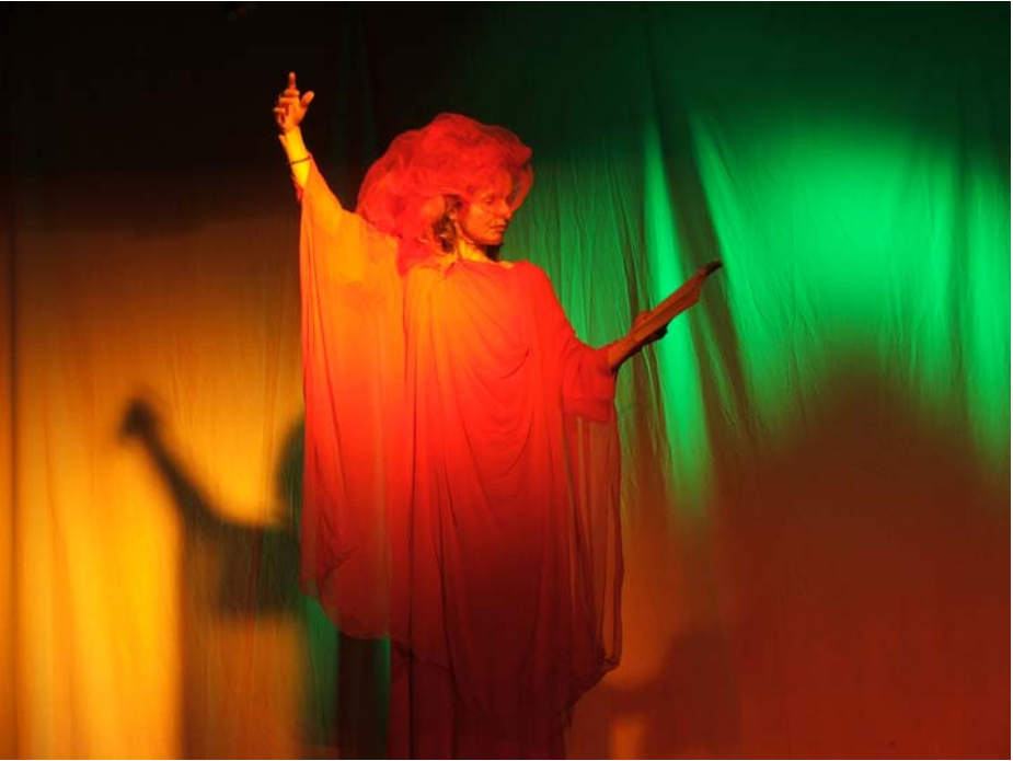
Luzifer (4. Bild)

Lustspielende fordert den Übergang in der Farbentönung vom grünlichen zum gelbroten oder rötlichen.