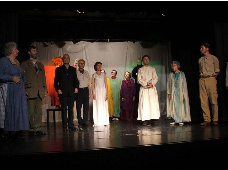
Der Sonnentempel (11. Bild)

So wie die andere Maria durch die edlen, aber dumpfen Kräfte ihres Fühlens das Geisteslicht an seiner vollbewussten Entfaltung gehindert hat, so hat in ähnlicher Weise Felix Balde, indem nur aus dunklen Tiefen schöpfen wollte, die Willenskräfte gebunden, wie ihm nun Romanus zu verstehen gibt. Doch nun hat auch Felix den Weg zum oberirdischen Tempel der bewussten Geistesschau gefunden und auch