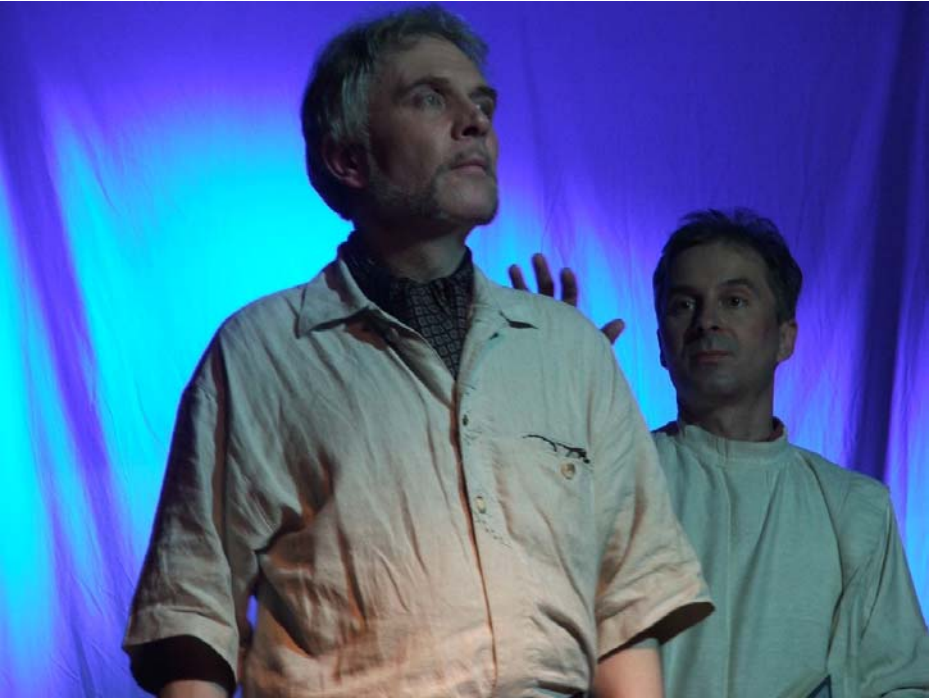
Johannes Thomasius und Theodosius (9. Bild)

teswesen entgegen, das ihm das Ziel bezeichnet, dem er in Zukunftszeiten gleichen will. So hell erstrahlt nun sein geistiger Stern, dass dadurch auch Maria, der er so eng verbunden ist, herbeigerufen wird und sein Licht in ihrer eigenen Seele erleben kann.