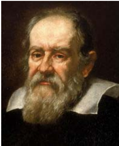
Galileo Galilei, Porträt von Justus Sustermans, 1636.

Die quantitative Erfassung der Naturerscheinung steht bei der herkömmlichen Naturwissenschaft im Vordergrund. "Messen, was messbar ist, und messbar machen, was nicht messbar ist", war hier seit Galilei der oberste Grundsatz. Messinstrumente, die die Naturerscheinungen quantitativ fassbar machen, sollen so weit als möglich die unmittelbare sinnliche Beobachtung ersetzen. Daran schließt sich eine mathematische Beschreibung der experimentell gefundenen Regelmäßigkeiten. Mathematisch formulierte Hypothesen werden dann aufgestellt, die diese Regelmäßigkeiten erklären sollen. Der Mensch als Beobachter wird aus der Theorienbildung vollkommen ausgeschlossen. Man strebt nach einer rein objektiven Naturbeschreibung, in der das betrachtende Subjekt keinen Platz hat. Die Natur ist fertig auch ohne den Menschen und die Naturgesetze wären dieselben, auch wenn es keine Menschen gäbe. Diese Methode hat sich ganz besonders an den mechanischen Erscheinungen bewährt und die hier gewonnen Erkenntnisse wurden dann sinngemäß auch auf alle anderen Naturerscheinungen übertragen. So entstand zunächst eine rein mechanistische, kausale Formulierung der Naturgesetze. Das Kausalitätsprinzip wurde erst zu Beginn des 20. Jahrhunderts durch die von Max Planck begründete Quantentheorie erschüttert.